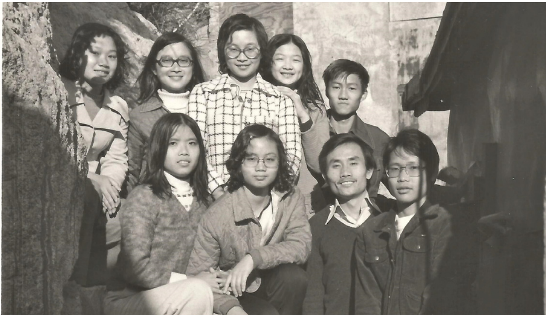
(圖右上方第一位是筆者)

筆者回憶上主的恩典，保守我直到如今。從我自己初信主至今的歷程，主都記在心裡，原來主是那麼重視我對祂的愛。我十六歲升中五那年受浸。當日受浸情景仍然歷歷在目，我心裡默默將自己奉獻給主。我自己個性膽小，沉默寡言；但主改變我，勇敢向人傳福音。我感受主喜悅我，不是我帶領了多少人信主，而是我歡喜親近主。若說我幼年的恩愛，就是我用了很多時間親近主。